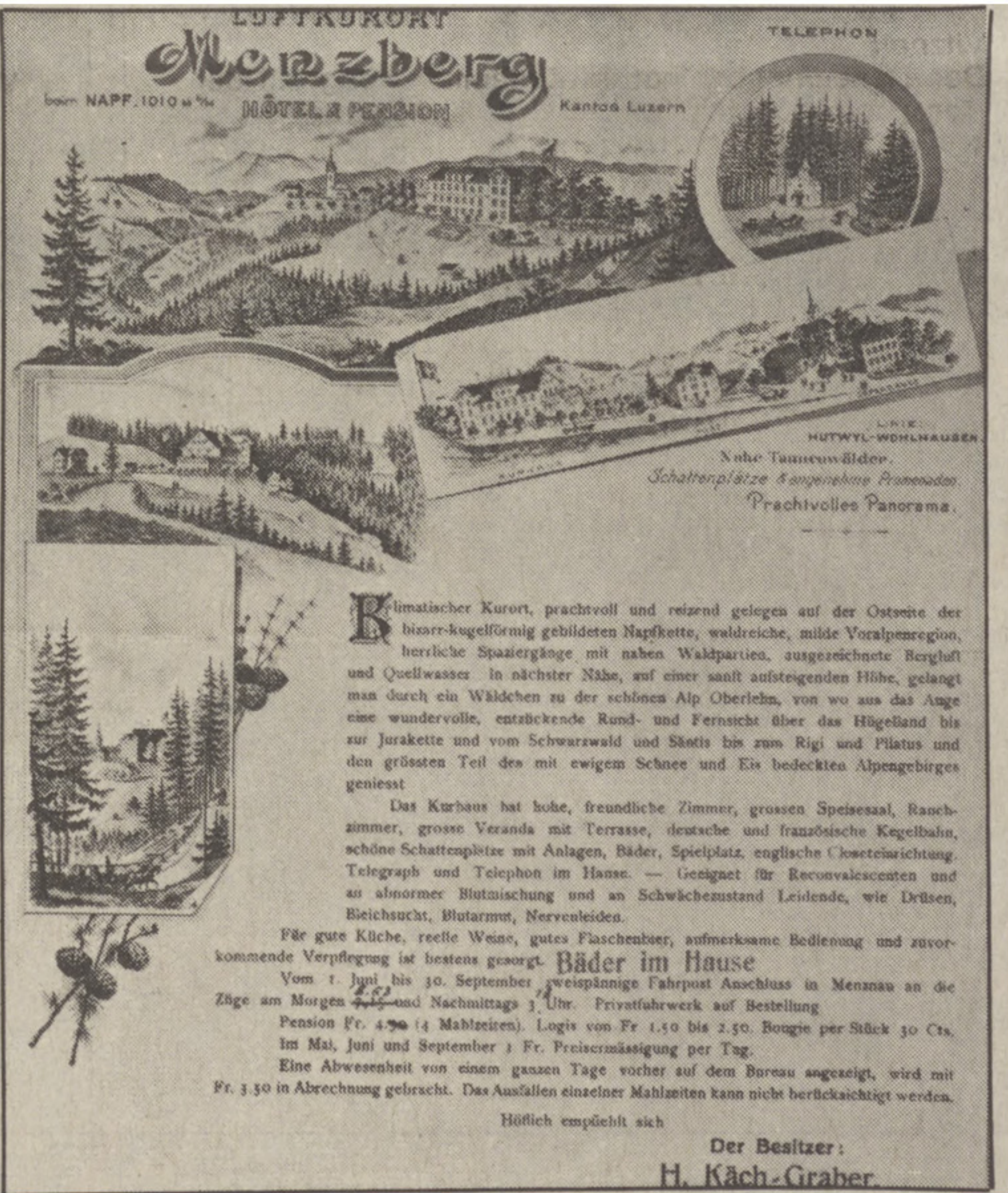
Ein Prospekt vom «Luftkurort Menzberg» aus der Zeit um die letzte Jahrhundertwende. Es tönt da fast wie ein Märchen, wenn man darin liest, dass die Tagespension (4 Mahlzeiten) 4 Franken betrug und für das «Logis» Fr. 1.50 bis 2.50 verlangt wurden.